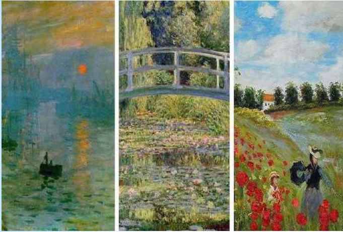
Pinturas de Claude Monet

El impresionismo es un estilo pictórico que se origina en Francia, en la segunda mitad del siglo XIX. Se caracteriza por su persistente experimentación con la iluminación. El manejo de la luz se considera como un factor crucial para alcanzar belleza y balance en la pintura. Los cuadros impresionistas se construyen técnicamente a partir de manchas bastas de colores, las cuales actúan como puntos de una policromía más amplia, que es la obra en sí. Por ello, al observar los lienzos es necesario tomar cierta distancia, para que aparezcan las luces sombras y figuras.